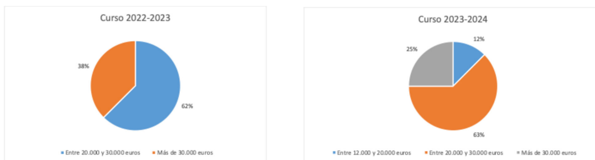
Figuras 21 y 22. Salario medio anual de los egresados de Ingeniería Eléctrica

El 100% de los egresados encuestados del curso 2022-2023 se encuentra trabajando y de los egresados del curso 23-24 encuestados, el 89% está trabajando y solamente uno busca trabajo. En cuanto al salario medio percibido, en el 22-23 el 100% de los egresados tienen un salario superior a 20.000 euros y en el curso 23-24 el 88% (figuras 21 y 22).