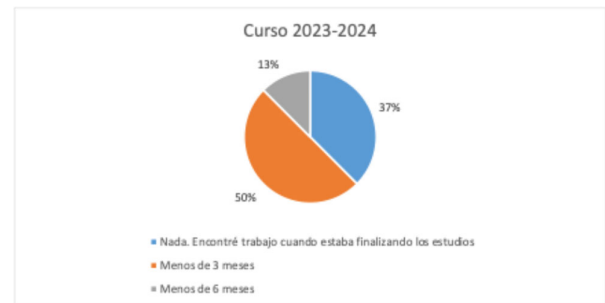
Figuras 23 y 24. Tiempo que tardaron en encontrar trabajo los egresados de Ing. Eléctrica.

Los sectores de actividad en que desempeñan sus trabajos los egresados de esta titulación están divididos, siendo la ingeniería en el que se encuentra un mayor número, figuras 24 y 25.