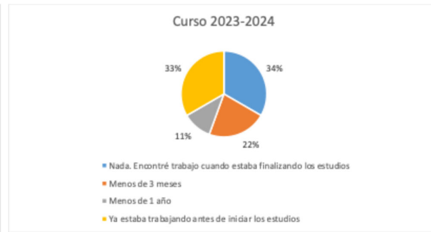
Figuras 19 y 20. Tiempo que tardaron en encontrar trabajo los egresados de Ingeniería Naval y Oceánica.

En lo que se refiere a los salarios, en ambos cursos académicos el 67% de los egresados obtiene un salario entre 20.000 y 30.000 y el resto perciben salarios por encima de 30.000 euros.